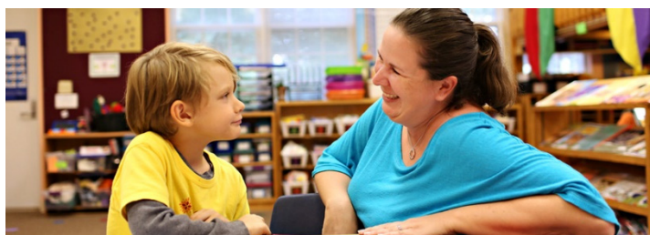
学生生活 STUDENT LIFE