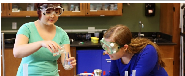
学生生活 STUDENT LIFE