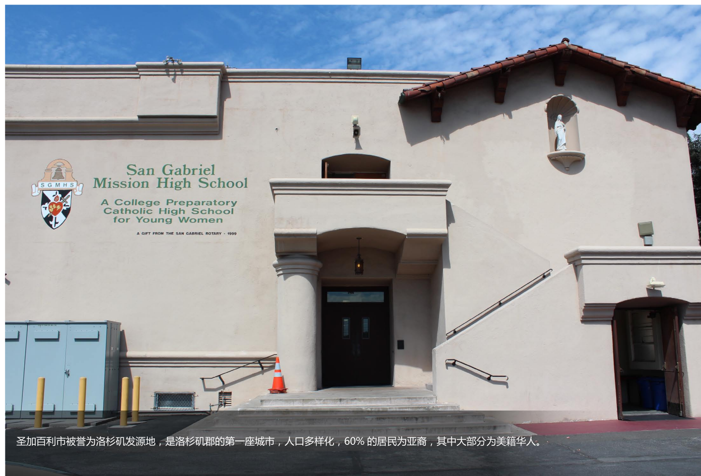
圣加百利市被誉为洛杉矶发源地，是洛杉矶郡的第一座城市，人口多样化，60%的居民为亚裔，其中大部分为美籍华人。