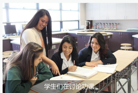
学生们在讨论功课

IB 预备课程： 学校正申请 IB 课程授权，目前为 9 年级和 10 年级生提供预备课程，为 11 年级 IB 文凭课程做准备。与此同时，学校也提供 AP 课程。 国际学生指导： 学校和美国剑桥国际教育合作，提供一种学术项目，满足中间水平国际生的需求帮助他们提高英语和学业表现，提高他们申请顶尖大学院校的几率。这门课程适合不同程度水平的学生学习，包括高级大学论文写作，托福，SAT 以及 ACT 备考课程。无论是单独学习或者分组学习，我们经验丰富的教师都会给学生额外的时间和关注，而这对于学业成功以及提高大学录取率都是很有必要的。作业、协调和师生的交流，这些能帮助我们了解学生的学习情况，这样我们训练有素的教师团队也可以为每个学生提供帮助。对于表现优异以及较差的学生，我们有额外的科目辅导，收费合理。