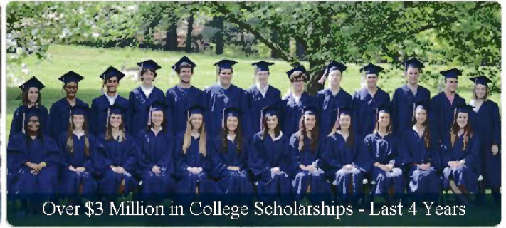
Over $3 Million in College Scholarships - Last 4 Years