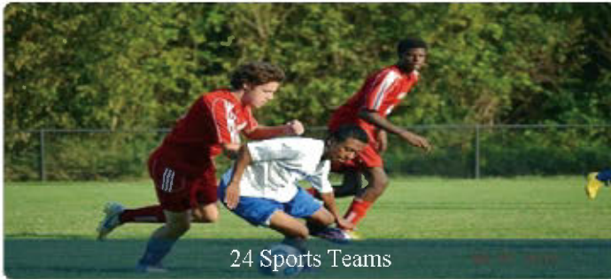
24 Sports Teams